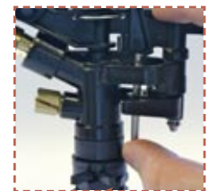
Sencillo desbloqueo del sector de riego

Boq. radio largo (vaina larga) + boq. radio corto